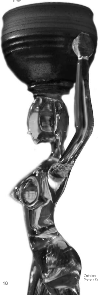
Création : Rhénauld Lecomte

26/27 septembre : réalisation d'un stuc, 10h30 - 18h